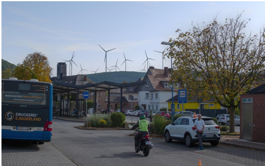
Bad Orb, Busbahnhof

Wir, die Unterzeichner, fordern den Verzicht auf die Bebauung des Horstberg bei Bad Orb, Biebergemünd, Jossgrund und bitten die Mitglieder der Hessischen Landesregierung und des Hessischen Landtages auf HessenForst und Ørsted einzuwirken, dieses Projekt nicht zu realisieren. Lt. Koalitionsvertrag beteiligen CDU und SPD die Kommunen an den Entscheidungen, ob Windkraftanlagen in deren unmittelbaren Umgebung gebaut werden.